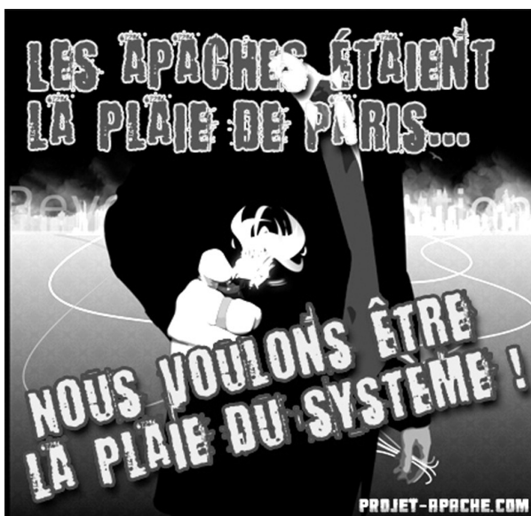
Quelques affiches de propagande du Projet-Apache – sous son nom propre ou, page suivante, celui d'une de ses émanations, le Cercle Sainte-Geneviève – en lutte pour préserver l'identité française et plus spécifiquement parisienne.

Nous visons plutôt une prise de pouvoir progressive à Paris, « par le bas », en plaçant le Projet-Apache comme tête de pont de projets politiques bien sûr, mais également culturels, associatifs, musicaux, artistiques, sportifs... voire économiques, en développant des réseaux alternatifs de consommation. Nous souhaitons conquérir les esprits plutôt que des électeurs, nous préférons accumuler les petites victoires plutôt que d'attendre un hypothétique « Grand Soir ». C'est pourquoi nous ne souhaitons pas entrer dans une logique de concurrence improductive avec d'autres mouvements. A contrario, nous pouvons, sur des thèmes qui nous paraissent primordiaux pour la sauvegarde de notre identité, à l'image de l'islamisation, apporter notre soutien